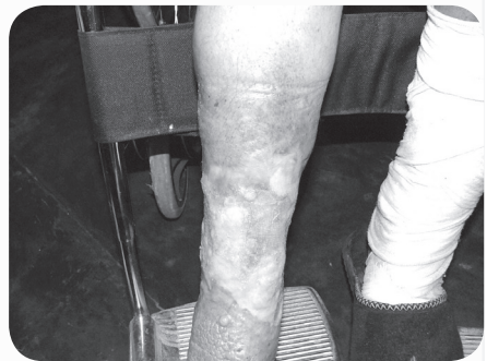
Han mejorado sus heridas