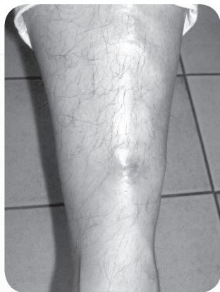
Su úlcera varicosa cerró totalmente