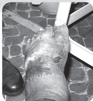
“el pie lo tenía muy hinchado tanto que parecía pie de elefante”

“Actualmente parece como si me hubieran cosido la herida porque cerró muy bien, ya tengo sensibilidad, me siento muy bien”