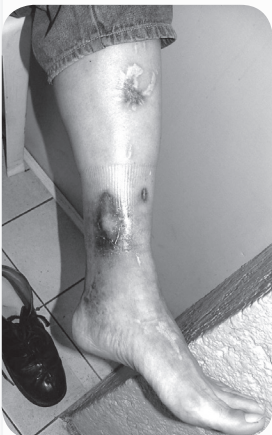
Le ha cerrado la herida de su pierna gracias a la Tintura de yervas